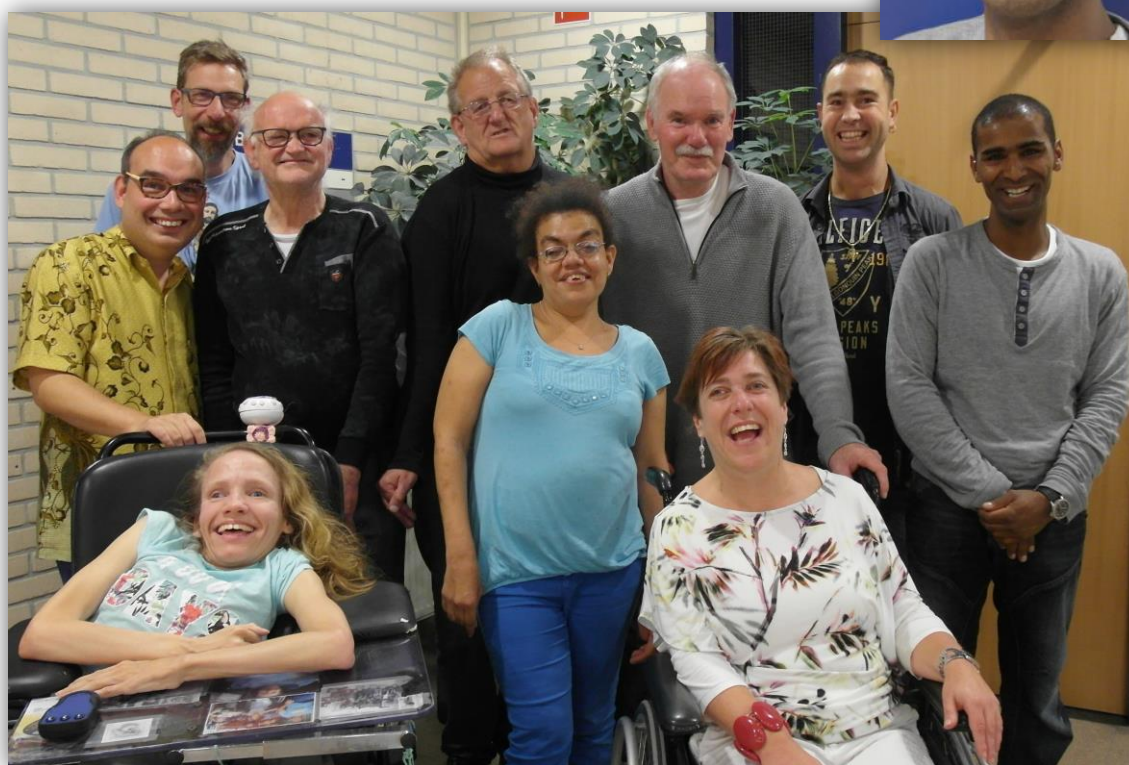
de nieuwe CCR